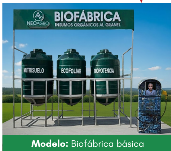
Modelo: Biofábrica básica